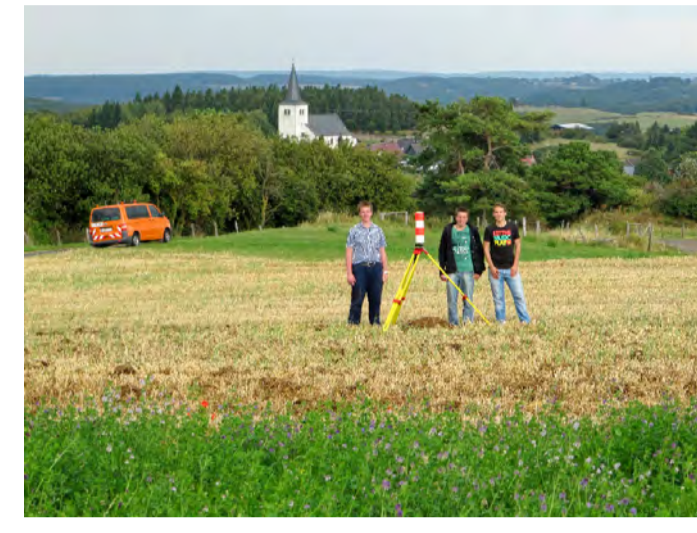
Mittelpunkt des Kreises Euskirchen

Der nördlichste Punkt des Kreises Euskirchen liegt im Villedwald ca. 3 km nördlich der Ortschaft Weilerswist zwischen der A 553 und der L 194.