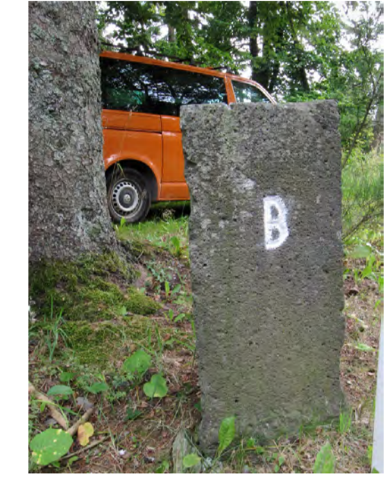
Grenzpfiler an der deutsch-belgischen Grenze