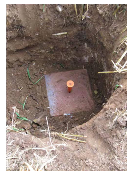
Vermarkung mit Lochplatte

Der Mittelpunkt des Kreises befindet sich auf einem Acker nahe des Ortes Weyer mit schöner Aussicht auf die Kölner Bucht. Die genaue Lage des Punktes wurde im Rahmen der Übungsarbeit mit einer unterirdischen Lochplatte vermarktet und als amtlicher Vermessungspunkt in den Katasternachweis übernommen.