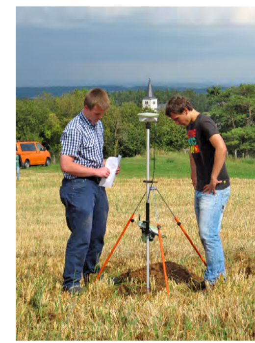
Absteckung des Mittelpunktes