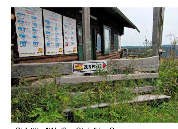
Skihütte "Weißer Stein" im Sommer