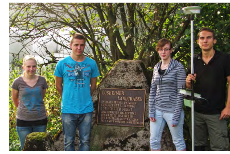
Panzersperre mit Hinweistafel