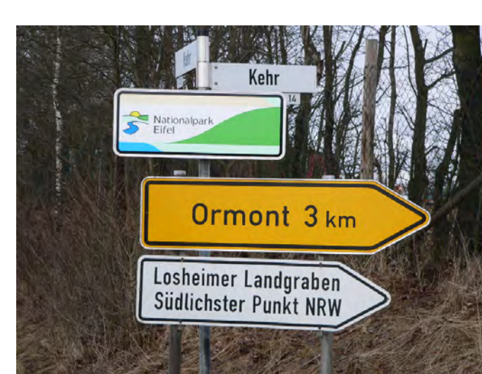
Wegweiser zum Südpunkt