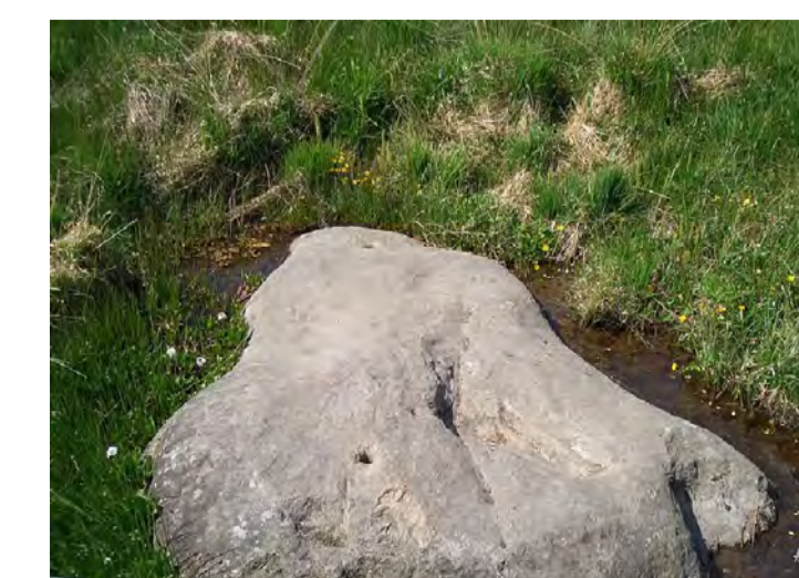
Weißer Stein in Belgien